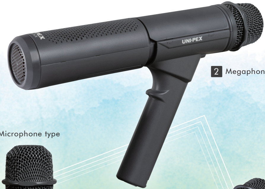
2 Megaphone type