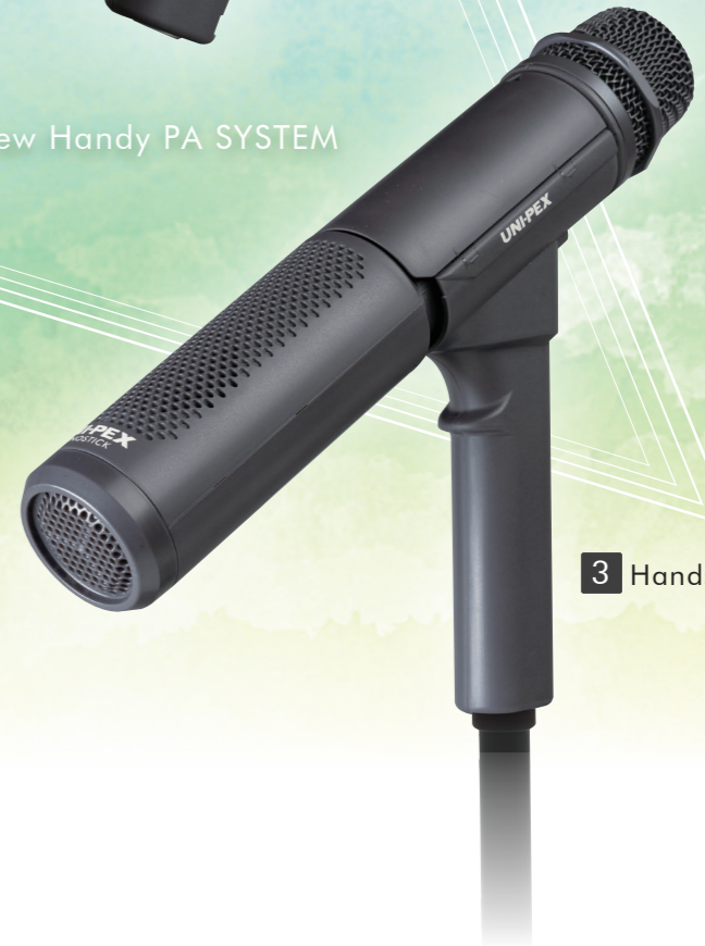
3 Hands-free type