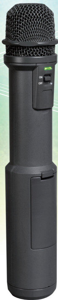
1 Microphone type